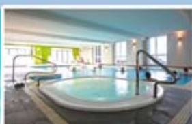
Piscine & Aquagym