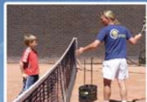
Stages pour enfants dès 3,5 ans !